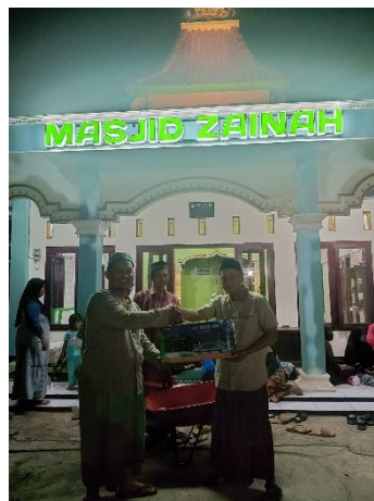
Penyerahan Jam Digital Untuk Mengetahui Waktu Sholat dan Bulan Ramadhan