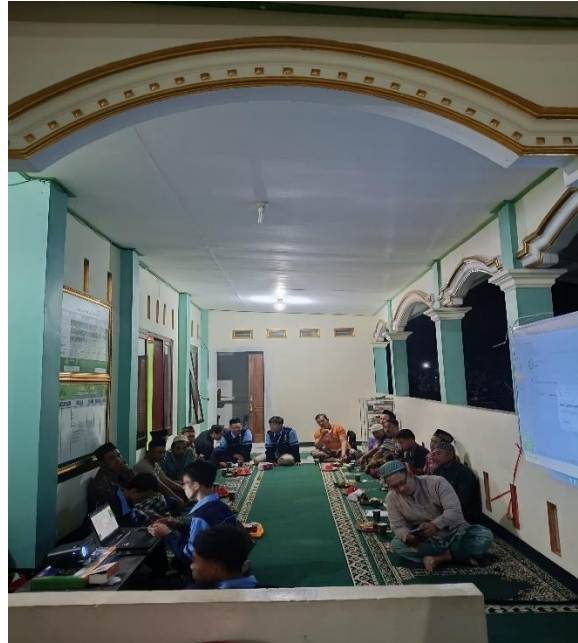
Pendampingan Penggunaan SIPZIS

Mitra, yaitu pengurus Masjid Zainah dan masyarakat sekitar, terlibat aktif dalam pelatihan penggunaan sistem ini. Pada bulan pertama, proses pengenalan sistem dilakukan, diikuti dengan transaksi yang mulai berlangsung di bulan kedua, baik oleh masyarakat sekitar maupun donatur dari luar daerah. Antusiasme ini menunjukkan penerimaan yang baik terhadap sistem SIPZIS.